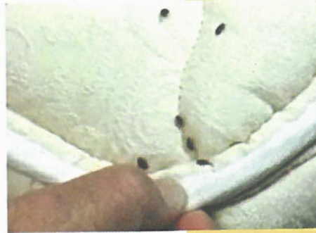
Des punaises de lit sur un matelas

Elles peuvent également se trouver dans n'importe quel objet qui leur offre un endroit sombre et étroit où elles peuvent facilement se dissimuler. Une fente de l'épaisseur d'une carte de crédit est suffisante pour constituer un abri pour les punaises de lit.